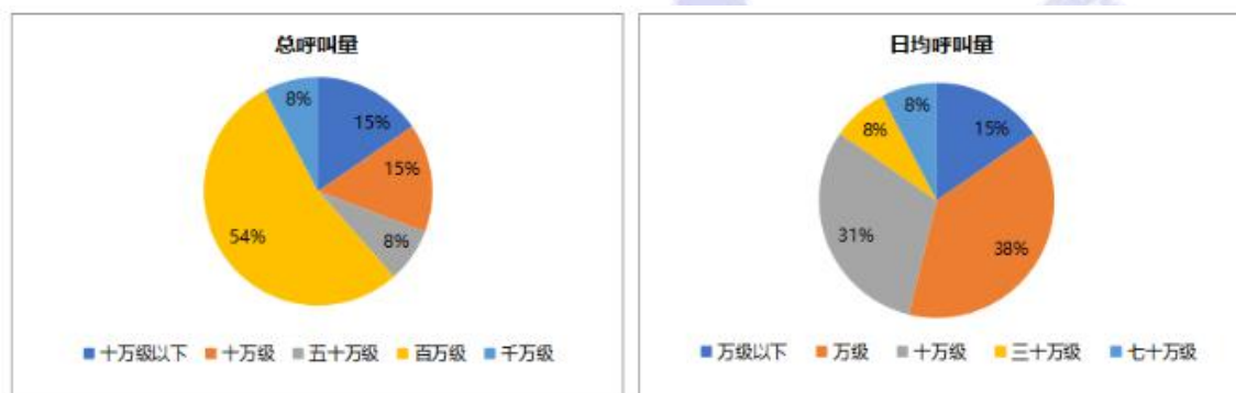
图3 中国人工智能产业联盟外呼机器人首轮评测结果呼叫量规模

如表1所示，大数据分析系统的应用场景主要有疫情地图、人群追踪、同乘查询、趋势预测以及舆情分析。大数据分析系统面向的对象包括医院、疾控中心、政府机关、企业、社区以及群众。以百度为例，其疫情地图产品提供针对新型冠状病毒肺炎疫情的实时大数据报告、包括疫情分布、疫情动态、迁徙地图、全民热搜、疫情实时播报等内容。同乘查询服务根据公开披露数据实时更新信息，用户可以查询自己所乘的飞机、火车、公交车等公共场所是否有确诊新型肺炎病例。